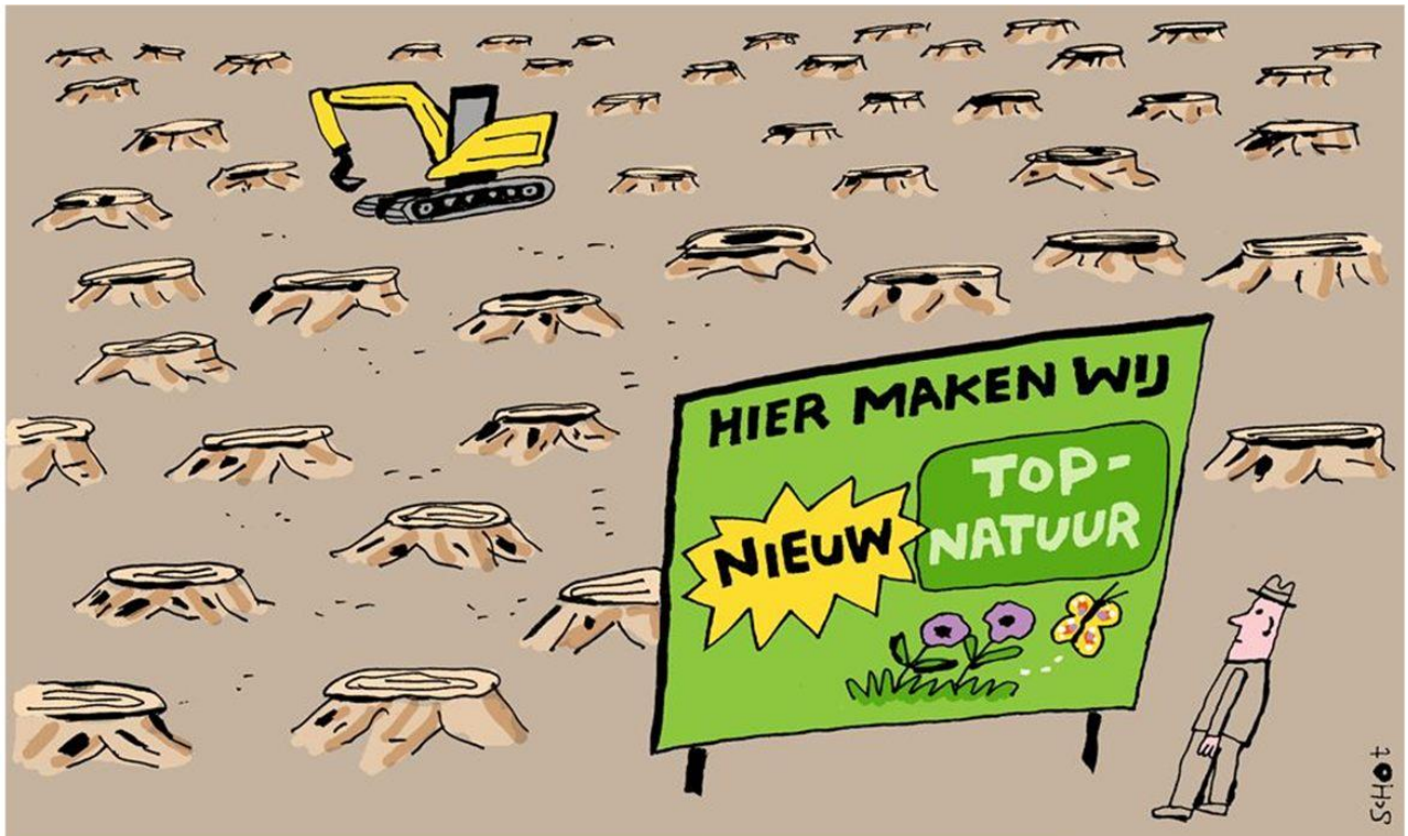
Deze cartoon stond op 28 april 2019 in de Volkskrant, hier geplaatst met toestemming van Bas van der Schot

Een onomkeerbare omvorming die tot oncontroleerbare risico's en problemen kan leiden met stuivend zand. Door menselijk ingrijpen in het gebied (boskap) ontstonden sinds de middeleeuwen verstuingen die voor grote overlast zorgden, plantengroei verstikte en zelfs hele dorpen deed onderstuiven. Om het gebied weer leefbaar te maken werd in de loop van de 19e eeuw begonnen met de aanplant van bos. Wij proberen met dit burgerinitiatief te voorkomen dat die ruim 170 jaar noeste arbeid teniet wordt gedaan.