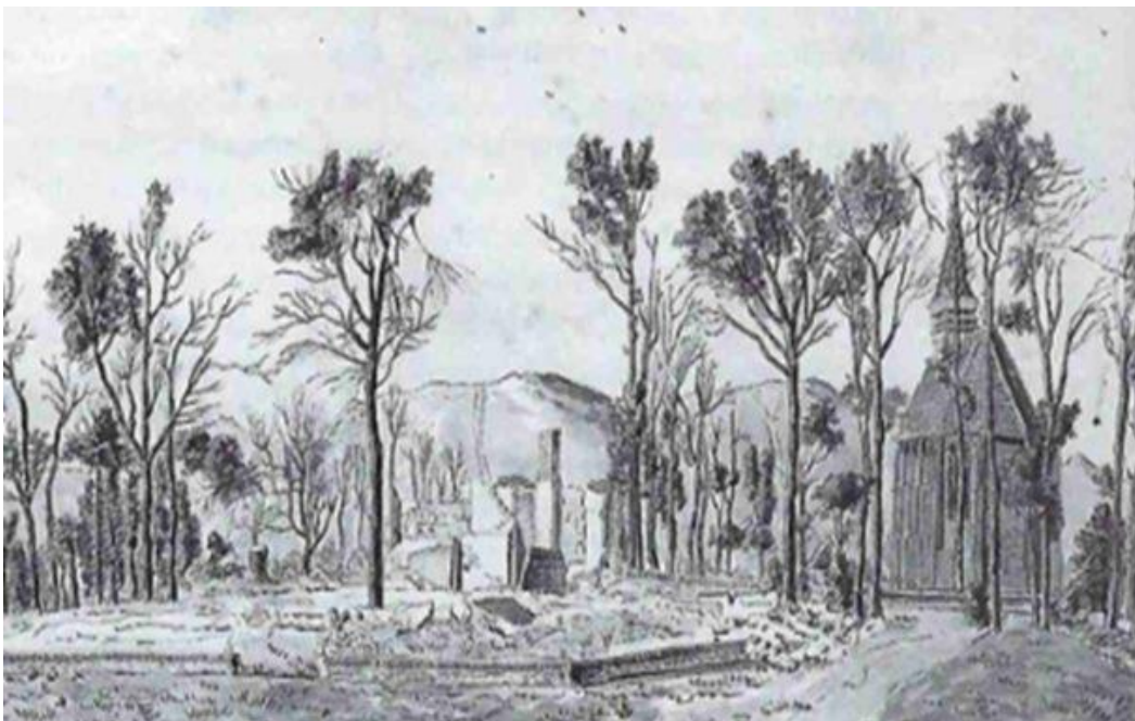
door al dat zand was er weinig animo voor herstelwerk na de verwoesting van Schoorl in 1799

- Het plan biedt geen mogelijkheden om in te spelen op veranderingen in het gebied, op veranderingen in de omgeving (zoals het verzet van de omwonenden), op veranderingen in denken over het milieu (stikstof depositie, fijnstof), noch op veranderingen in het denken over het klimaat (bomen zijn nodig als temperatuurregelaar en voor opslag van CO 2 ). Urgenda, Mobilisation for the Environment MOB, het Luchtfonds, het Astmafonds, Longartsen, van alle kanten is er een roep om schone lucht. Die schone lucht verzorgen bomen voor ons. Juist bij uitstek de dennenbomen filteren het fijnstof uit de lucht. Door deze bossen te kappen berooft u burgers van schone, zuivere lucht.