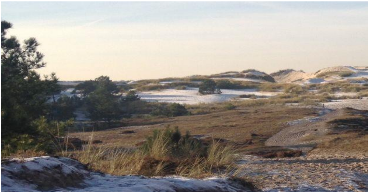
in Schoorl is er juist heel veel grijs- en wit duin