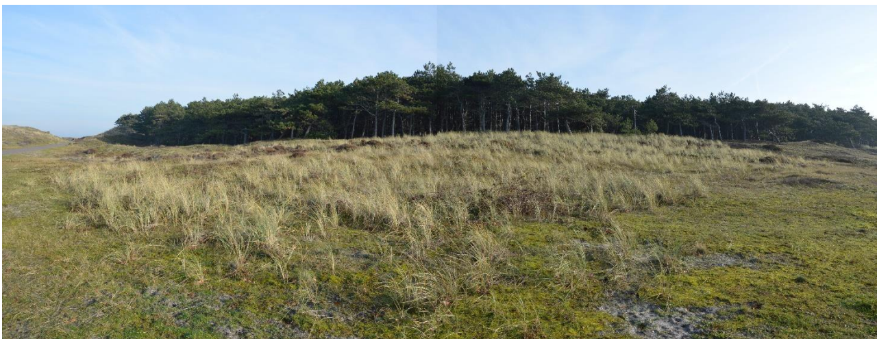
het Leeuwenkuilbos, omringd door grijs duin (grasland met zanderige gedeeltes) gezien vanaf de westzijde (foto d.d. 24-11-2019)

Het zijn de enige bossen die nog zorgen voor een klein beetje luwte in het midden duingebied. Luwte waarin heel veel zeldzame flora en fauna een plekje heeft gevonden.