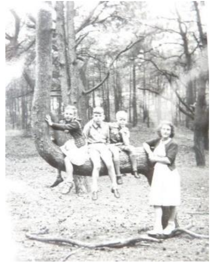
het Schoorlse Bos in 1949 (zat bij een ondersteuningsverklaring; geplaatst met toestemming)

Ik hoop dat heel veel mensen mee doen. Het is een gebeid waar ik elk jaar weer een dag met heel veel plezier doorheen wandel. Vraag me af of het nog zin heeft lid te zijn van natuurmonumenten. Eerst de Oostvaardersplassen nu dit weer.