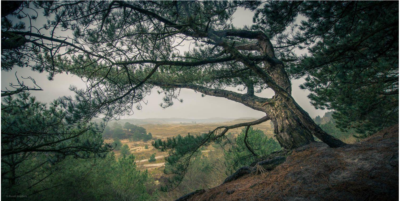
doorkijkje vanaf de Baaknol over een grote vlakke grijs duin

Vragen, zorgen en boosheid die niet alleen bij ons bestaan, maar ook bij heel veel anderen. Het is voor directe omwonenden, alsook voor burgers van wat verder weg, nog steeds onbegrijpelijk dat onze overheid van plan is om de mooie bossen in de Noord-Hollandse duinen te kappen.